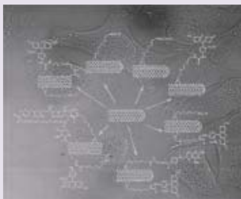
شکل ۲. چند نوع مختلف از نانولوله های کربنی عامل دار که می توانند به صورت منفرد و مناسب در محیط های زیستی پخش شوند.

جالب است که ساختارهای نانولوله ای مدل برای ایجاد برهمکنش با دولایه های چربی از طریق یک فرایند انتشار و عبور مستقیم از غشاهای زیستی پیشنهاد شده اند (شکل ۳) نشان دهنده آن است. نفوذ خودبه خودی در غشا با کنار زدن مولکول های چربی یک فرایند مستقل از انرژی بوده و به گیرنده، روکش، یا برهمکنش های شاخه های لیپیدی وابسته نیست؛ بنابراین می تواند در تمام انواع سلول ها اتفاق بیفتد (برعکس اندوسیتوز). لوپز و همکارانش انتشار خودبه خودی نانولوله های عامل دار شده با شاخه های آب دوست در غشاهای دولایه ای چربی را با استفاده از