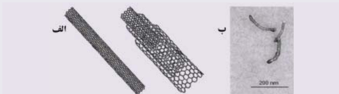
شکل ۱. الف) شمایی از نانولوله کربنی تک دیواره (چپ) و چنددیواره (راست)؛ ب) تصویر میکروسکوپ الکترونی عبوری از \text{CNT-NH}_3^+ .

ایجاد گردیده است. ما به صورت تجربی مشاهده نموده ایم که نانولوله های کربنی می توانند با غشاهای پلازما برهمکنش نموده، به درون سیتوپلاسم نفوذ کنند؛ در این مطالعات اولیه نانولوله های کربنی، توانستند DNA پلاسمید را درون سلول ها جابه جا کنند.